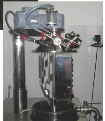
VAKUM MIKSER 30L